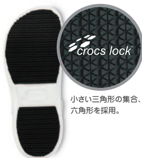
小さい三角形の集合、六角形を採用。