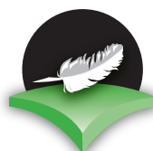
軽量 light weight

この「クロスライト」素材が、軽くて快適な履き心地を実現するシューズづくりを可能にしているのです。このような特徴を持つクロックスのフットウェアは、日常生活だけでなく、仕事時やレクリエーション時の使用にも最適です。