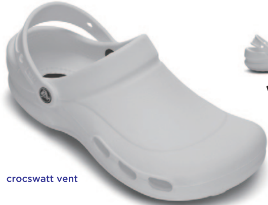
crocs watt vent